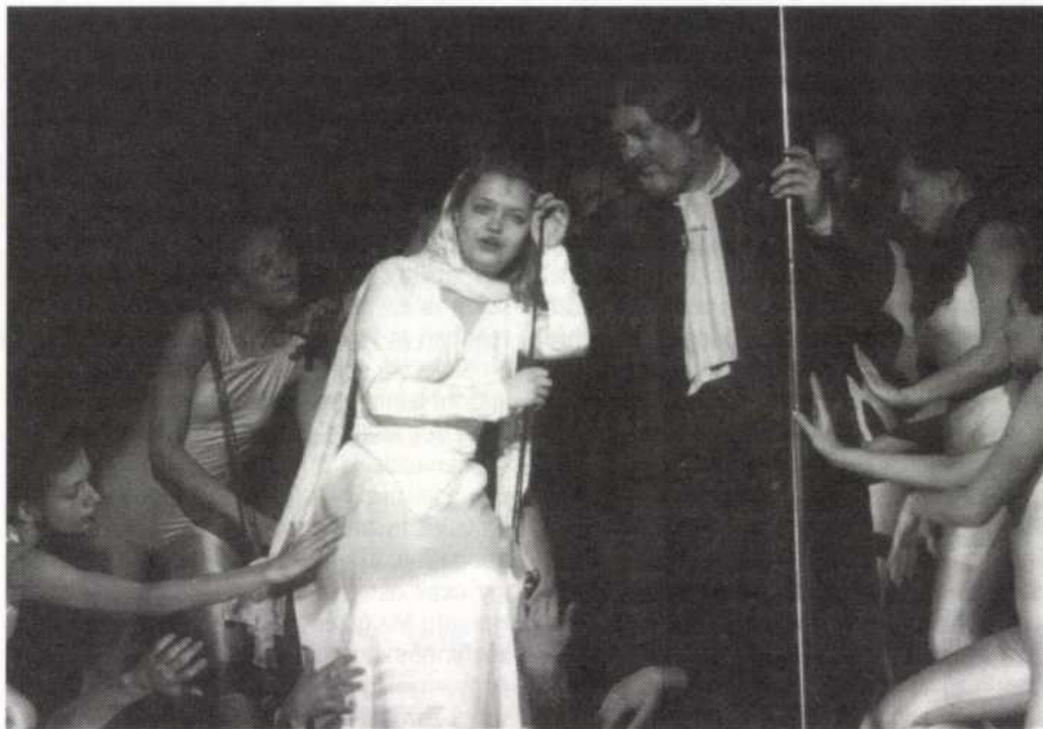
Jelenet a békéscsabai Ármány és szerelem-ből