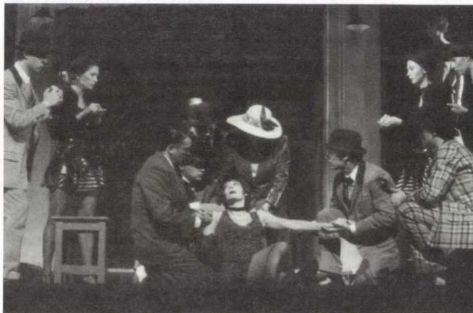
Jelenet a József Attila Színház Chicago című előadásából

sebb betűkkel írt nevek is (Maurine Dallas Watkins, Bob Fosse, illetve John van Druten, Christopher Isherwood, Joe Masteroff), nekik szintén fontos szerepük van abban, hogy állandóan repertoáron szerepelnek ezek a musicalek.